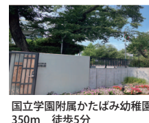
国立学園附属かたばみ幼稚園 350m 徒歩5分