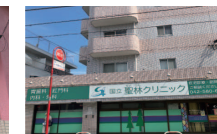
国立聖林クリニック 450m 徒歩6分