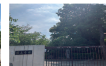
国立学園小学校 400m 徒歩5分