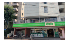
コブみらい ミニコブ国立西店 450m 徒歩6分