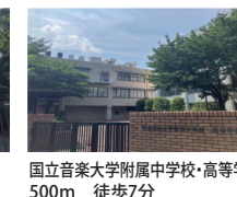
国立音楽大学附属中学校・高等学校 500m 徒歩7分