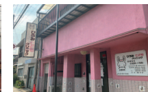
ひろみこどもクリニック 500m 徒歩7分