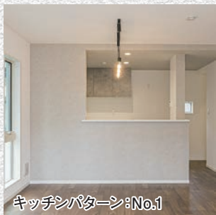
キッチンパターン: No.1

06 ウォークインクローゼットを設え、 バルコニーから連なる ゆとりを持たせた広々主寝室。