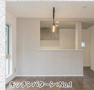
キッチンパターン:No.1