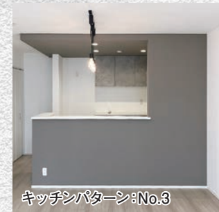
キッチンパターン: No.3