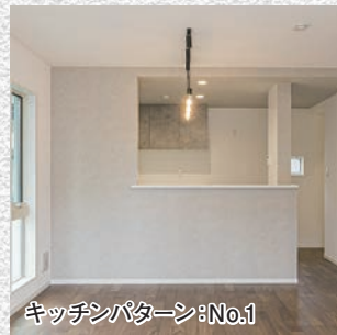
キッチンパターン No.11