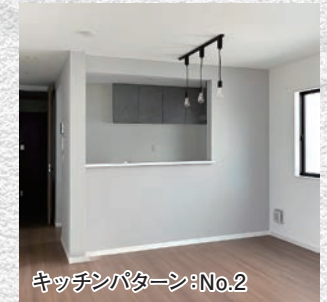
キッチンパターン:No.2