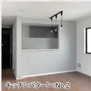
キッチンパターン: No.2