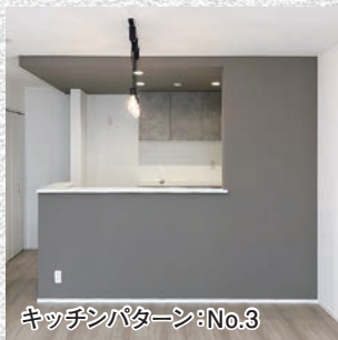
キッチンパターン:No.3